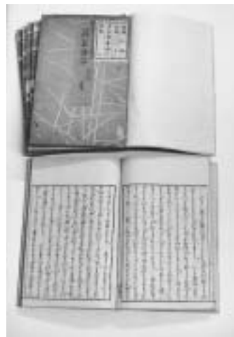
上田秋成著『藤簾冊子』(文化4年)