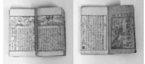
十返舎一九序『早見道中記』(文化2年)