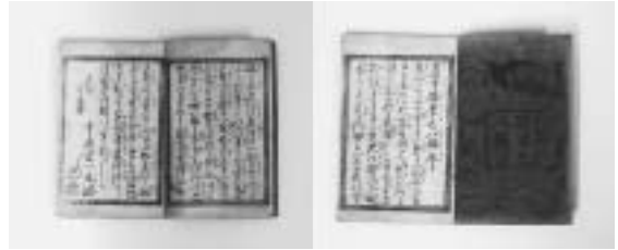
十返舎一九著『道中膝栗毛』(享和2~文化6年)