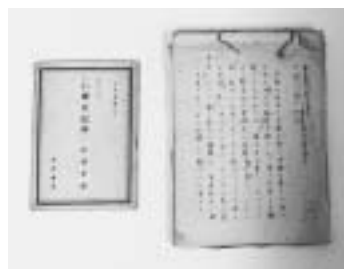
『仁齋日記抄』(手沢本、1946)とその原稿