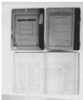
学生時代の「筆写ノート」