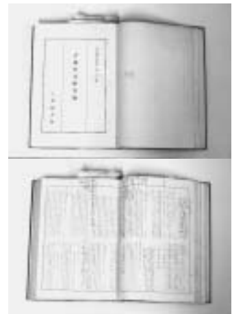
『古義堂文庫目録』(手沢本、1956)