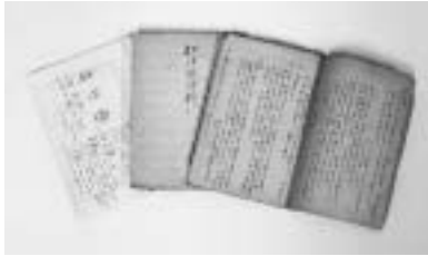
「戯作論資料」(自筆ノート)