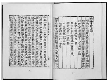
『桂苑筆耕集序』の冒頭

[韓国の3450人の士人、文人、学者、武人、高僧等が残した統一新羅時代から現代に至る漢詩文集を取録したものである。この叢書は、ほとんど見ることのできない筆写本などの稀覯本も網羅されており、韓国の文学、歴史、思想、文化だけでなく、言語、政治、社会、経済、など広範囲な学問領域を理解、研究する上での基本資料。今回は全30輯の内10輯を購入]