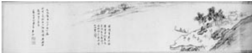
岡田半江「山水図巻(大川納涼図)」巻頭(上)の題字と巻末(下)の部分 絹本墨画淡彩 14.7×400.7cm

送別図巻」(弘治10年・紙本水墨横巻・上海博物館蔵)では、弘治10年(1497)に友人で蘇州の文人呉寛(1435-1504)が北へ旅するにあたり、沈周が京口、すなわち現在の江蘇省鎮江に送りに行きまして、この巻物を描いて送別の気持を表明したといひます。このように文人画家たちの交流における書画の贈答という友情の証ほど、文人画の性格を端的に物語るものはないでしょう。この観点から考えてはじめて、文人画家の田能村竹田が、大画面ではいささか精彩を欠くにもかかわらず、なぜ小画面の絵画において鋭い才気を示し、その制作に情熱を傾けたのかという疑問の一端が明らかになります。また、色紙などの膨大な小画面の絵画を遺した大坂画壇の画家たちの状況も注目すべきだと思います。