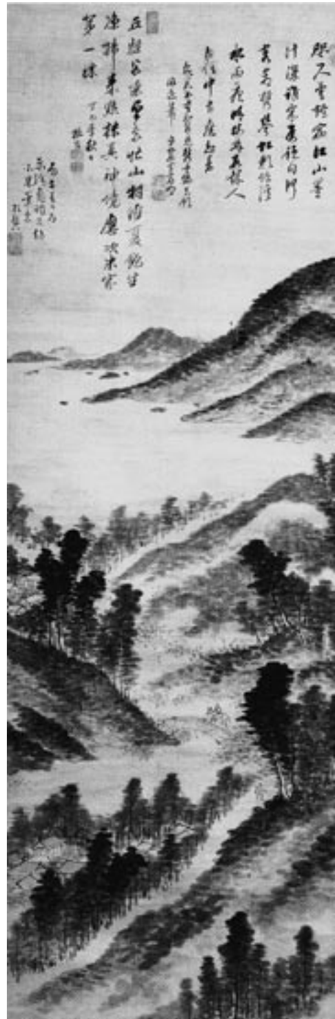
木村兼葎堂「米山山水図」

玉堂や浜田杏堂をはじめ、あちこちの文人墨客と親交を重ねましたので、兼葎堂の住処は、いわゆる文化サロンのような溜り場となっていました。これほど重要な兼葎堂の顕彰が、地元の大阪でもほとんど行われなかったというのは驚きでもあり、情けないことでもあります。平成15年(2003)になってやっ