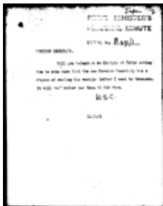
「松岡洋右外相への警告状」に関するチャーチル首相の指示書